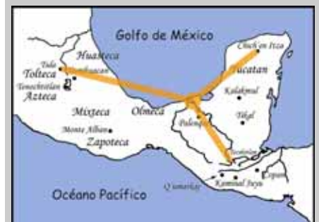
Relaciones comerciales de los Ajq'analakam y Ajcopilcat , pueblos del Golfo de México.