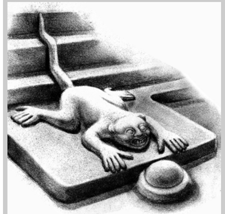
Arreglo gráfico del "Jaguar de Chicruz"

Un campesino del lugar muestra asombro al descubrir, que el obstáculo que solía chocar con su arado no era una roca, sino la cabeza de una escultura misteriosa que formaba parte de un altar para sacrificios humanos al pie de una pirámide.