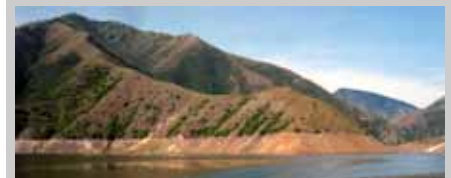
Los Encuentros hoy en día; sólo las puntas de los cerros se elevan sobre las aguas.