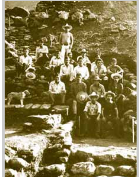
Equipo de excavación en El Talpetate , Kawinal.

Puntas bifaciales y puntas de flecha de obsidiana, ocarina de tres cuerpos.