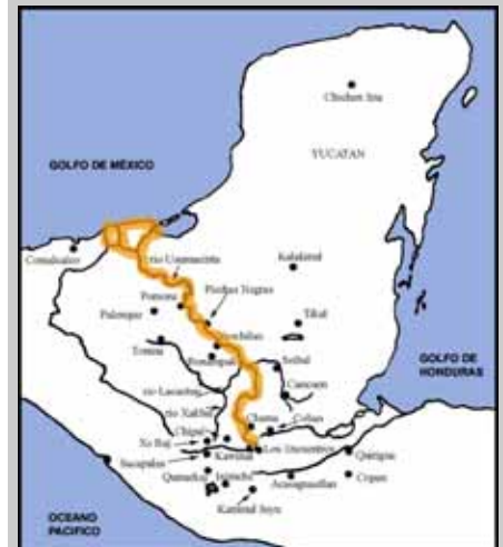
Ruta de inmigración de la gente de la costa del Golfo de México que llegaron a Rax Ch'ich' por la cuenca del río Usumacinta-Salinas-Chixoy.

Tumbas abovedadas, típicas de las Tierras Bajas.